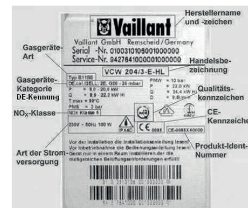
Beispiel Typenschild der Fa. Vaillant

Bitte besorgen Sie für Ihr Gasgerät ein Typenschild vom Hersteller. Vorsorglich weisen wir darauf hin, dass Gasgeräte ohne Typenschild nicht angepasst werden können.